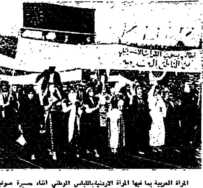
المرأة العربية بما فيها المرأة الأردنية باللباس الوطني أثناء مسيرة صوفيا التي نذبت بالاحتفال الصهيوني للأراضي العربية وطالبت بالانسحاب السوري لقوات العدوان

مركز التوزيع والصلح يوسف بحوث وشركاه - عمان جبل اللويدة - تلفون ٣٦٢٢٩